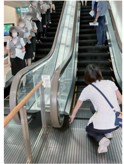
実際の訓練の様子