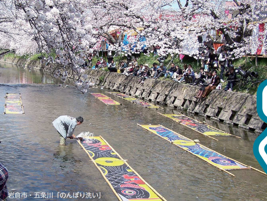
岩倉市・五条川「のんぼり洗い」